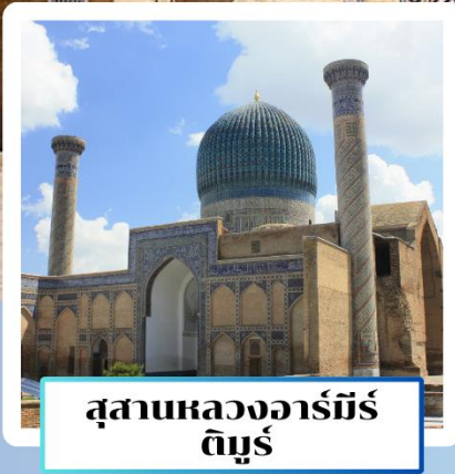
สุสานหลวงอาร์มีร์ ติมูร์