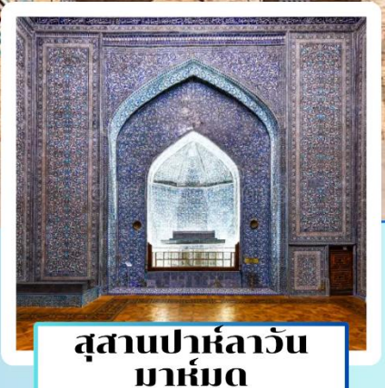
สุสานปาห์ลาวัน มาห์มุด