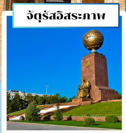
จัตุรัสอิสระภาพ